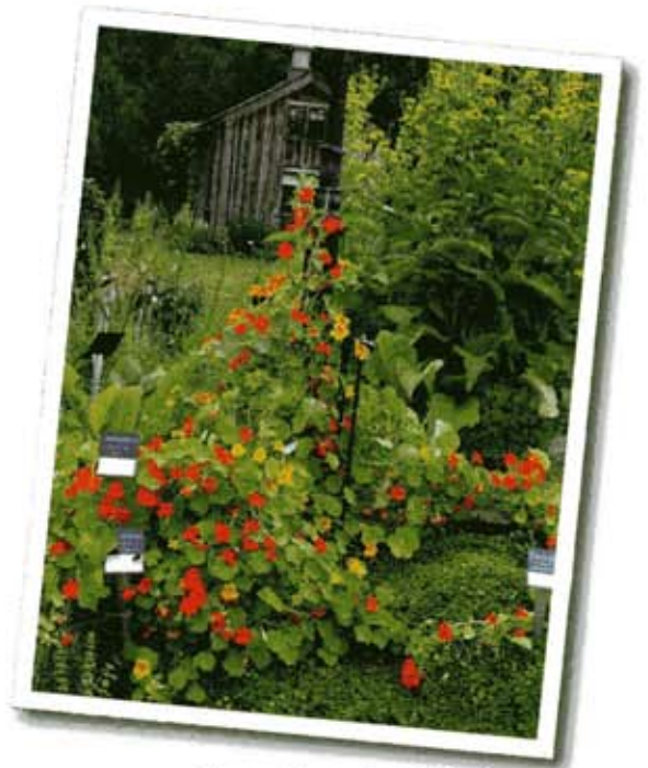
Tropaeolum majus, indiankrasse i Örtagården i Dals Rostock.